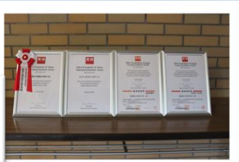
英検は4年連続学校賞受賞！