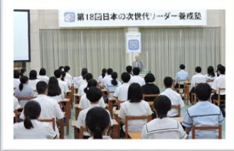
日本の次世代リーダー塾